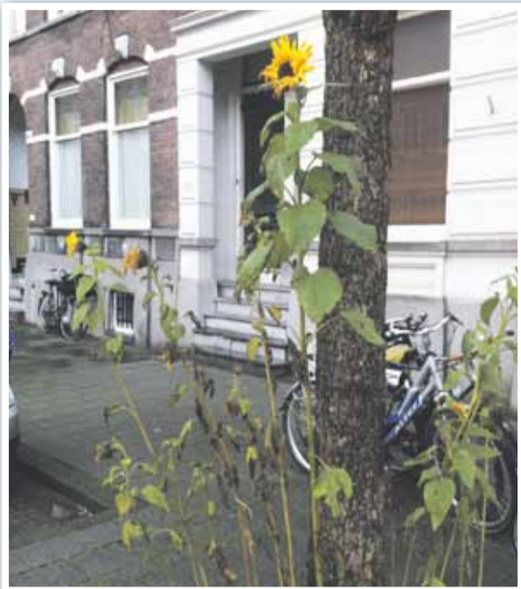
Ochtervelstraat, zonnebloem in zachte winter

We zitten alweer dicht tegen het voorjaar aan. Hoe anders was dat tijdens het schrijven van dit stuk; er was niet veel wat aan nieuw leven deed denken. Sterker nog, de gemeentelijke kerstbomen stonden opgetuigd in de diverse straten (hoewel hun dagen waren geteld). Het was even zoeken naar mensen die zich met het thema 'groen in de stad' bezighielden.