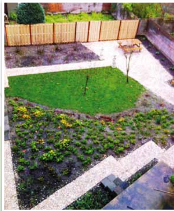
Ochtervelstraat, voornamelijk door de bewoners zelf opgeknapte binnentuin

'Het was hier een wildernis van onkruid en berenklauw. We hebben de woningbouwvereniging gevraagd de tuin een flinke opknappbeurt te geven. Dat wilden ze wel doen, mits de bewoners een actieve bijdrage zouden leveren. Nadat er een ontwerp was gemaakt hebben we toen onder leiding van een aannemer zes zaterdagen hard gewerkt, met als resultaat een binnentuin waar je graag naar kijkt.' Op het dieper gelegen grasveld staan een appel- en een perenboom. De besdragende struiken eromheen zijn bedoeld om vogels te lokken en de kamperfoelie moet insecten aantrekken. Er is een hoekje vrijgelaten voor een eventuele moestuin. De tuin is onderhoudsvriendelijk; behalve het gras dat gemaaid moet worden hoeft er alleen af en toe onkruid te worden verwijderd. Tuin en bewoners zijn helemaal klaar voor het voorjaar.